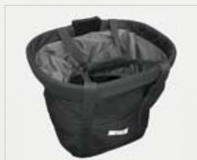
Cestino-borsa anteriore con manici e coulisse, impermeabile, capiente e facilmente asportabile, utile anche per riporre la batteria.