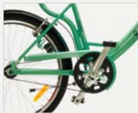
Trasmissione a cinghia.

Adatta ad un pubblico di tutte le età, anche grazie alla sua leggerezza (18,9 kg), è caratterizzata da un design tradizionale e dalla trasmissione a cinghia che, come il cardano, evita problemi di manutenzione alla catena, causa di macchie di grasso su mani e vestiti.